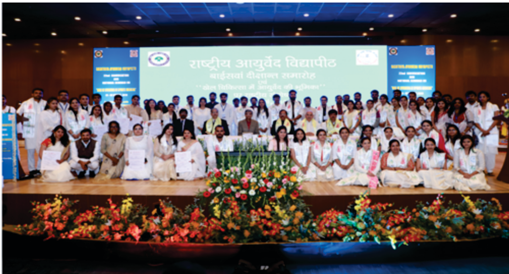
A still image of the students received certificates on the occasion of convocation held on 1-2 March, 2019 in Delhi in the august presence of Hon'ble dignitaries.