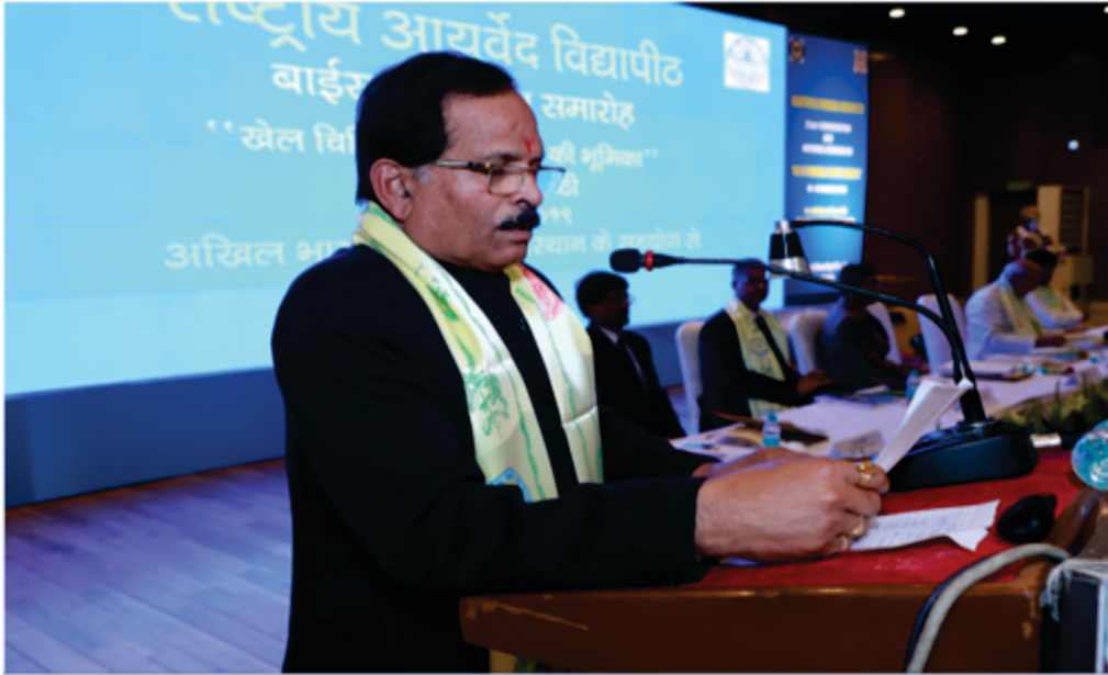
Shri Shripad Yesso Naik, Hon'ble Minister of State (Independent Charge), AYUSH is addressing the gathering in the two day national seminar on 'Role of Ayurveda in Sports Medicine' held on 1-2 March, 2019 in Delhi.